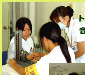
トクン、トクン音が聞こえます。

着替えた参加者は「もう気分は白衣の天使」、みんなやる気満々です。午前中は病棟で患者様とのコミュニケーションや看護見学をいたしました。「看護師と患者さんの対話を聴いてプロを感じ、すごいと思った」、「点滴をしている看護師を見てカッコ良かった」、「以前からあこがれていた看護師の白衣が着れてうれしかった」等の感想がありました。午後からは練習用模型を使っての実践体験や血圧測定を行いました。参加者は看護師の説明に真摯に耳を傾け、緊張感の中にも笑顔のをぞかせながら、看護学生宛らの体験をいたしました。この体験を通じて、看護師の仕事に関心を持ち、一人でも多くの方が看護師の道を目指していただけたら幸いです。(看護師 八木房子)