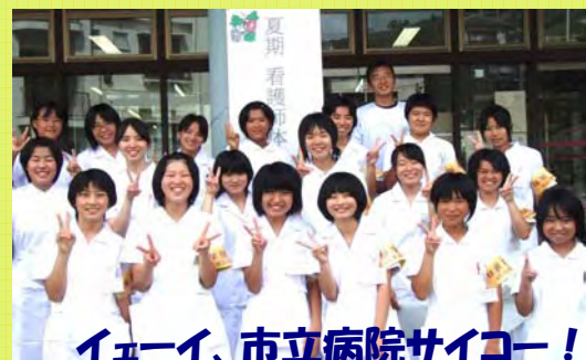
イエーイ、市立病院サイコー！